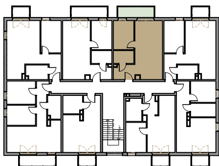
RZUT I PIĘTRA BUDYNEK B

Przedstawiona oferta ma charakter informacyjny, nie stanowi oferty handlowej w rozumieniu Art.66 par.1 Kodeksu Cywilnego