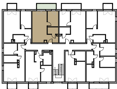
RZUT I PIĘTRA BUDYNEK A

Przedstawiona oferta ma charakter informacyjny, nie stanowi oferty handlowej w rozumieniu Art.66 par.1 Kodeksu Cywilnego